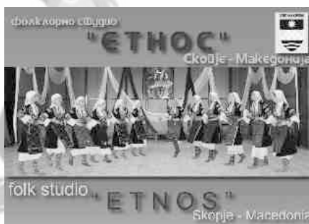
KUD ETNOS Skopje MACEDONIA