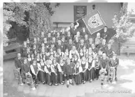
Musikverein Zeitvertreib Ulsenheim