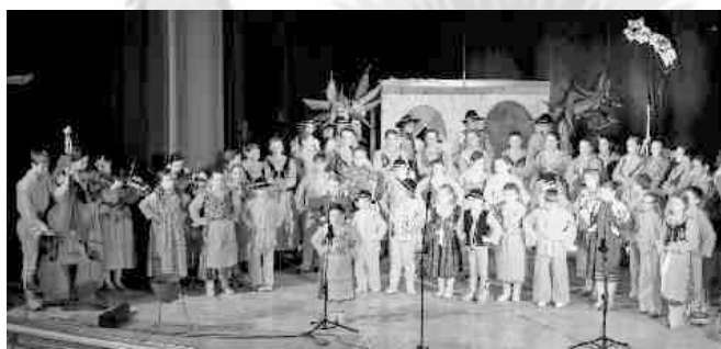
ZPiT PILSKO Żywiec