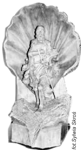
fol. Sylwia Skros

Święty Jakub Starszy (Większy) należał do grona wybranych Dwunastu Apostołów. Jego rodzicami byli Zebedeusz - rybak z Betsaidy i Salome. Jezus powołał go do grona Apostołów wraz z bratem Św. Janem Ewangelistą (por. Mt 4, 21-22). Święty Jakub był świadkiem najważniejszych wydarzeń zbawczych (wraz ze Świętymi: Piotrem i Janem) - jak: uzdrowienia córki Jaira, przemienienia Jezusa Chrystusa na górze Tabor, modlitwy Zbawiciela w Getsemani w godzinę wybrania drogi męki i cierpienia. Po Zesłaniu Ducha Świętego i powstaniu pierwszej gminy chrześcijańskiej Św. Jakub jako pierwszy z Apostołów oddał życie za Jezusa. Został ścięty mieczem w Jerozolimie, na rozkaz Heroda Agryppy I. Tradycja