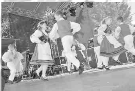
REMUSOWE SKRZATY 3