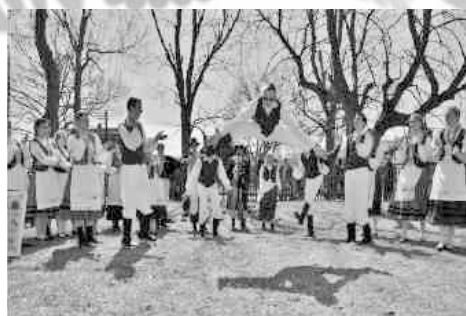
ZPiT ZIEMIA ŁĘBORSKA